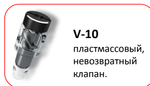
V-10 пластмассовый, невозвратный клапан.